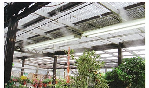
フラワーショップで使用