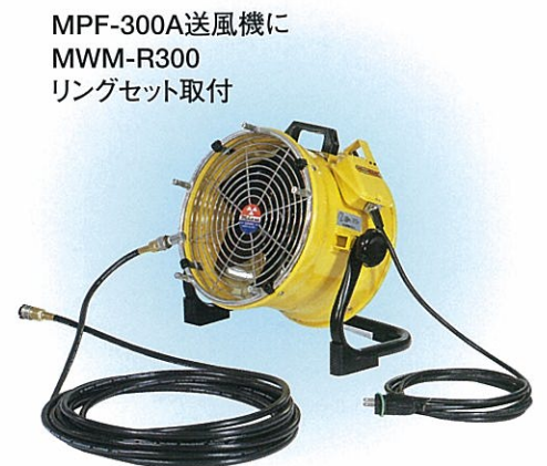
MPF-300A送風機に MWM-R300 リングセット取付