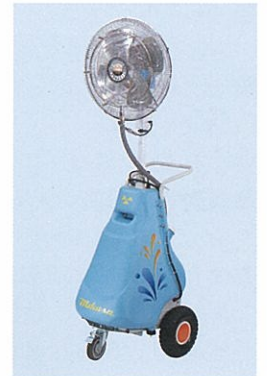
WM-500 一体型エポックミスト