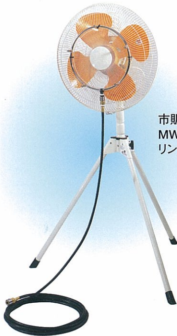
市販の工場扇に MWM-R300 リングセット取付